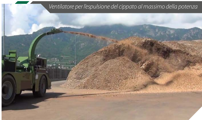
Ventilatore per l'espulsione del cippato al massimo della potenza