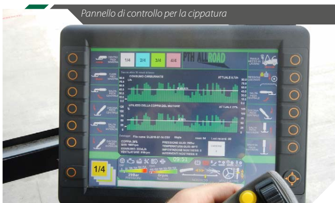
Pannello di controllo per la cippatura