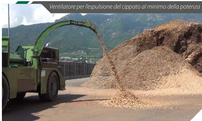
Ventilatore per l'espulsione del cippato al minimo della potenza