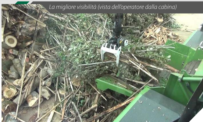
La migliore visibilità (vista dell'operatore dalla cabina)