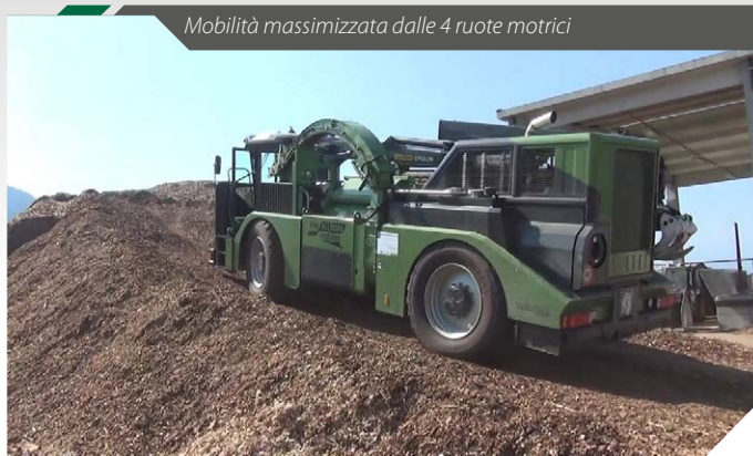
Mobilità massimizzata dalle 4 ruote motrici