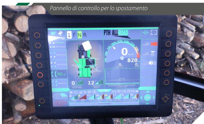
Pannello di controllo per lo spostamento