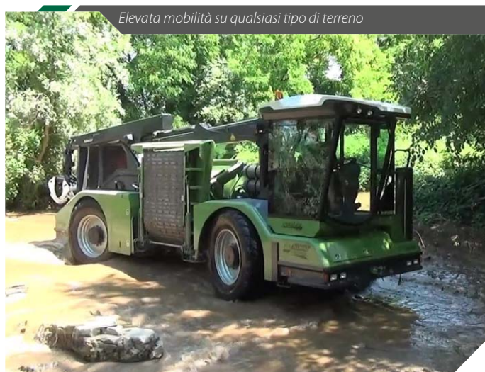
Elevata mobilità su qualsiasi tipo di terreno

La bocca di alimentazione è stata posta relativamente in basso per velocizzare il lavoro sia con il materiale in piccoli mucchi, come quello disponibile nei frutteti e nei pioppeti, sia con il legname raccolto in grosse cataste a bordo strada. Per agevolare l'inserimento di materiale voluminoso come la ramaglia, il rullo di alimentazione inferiore è stato sostituito dalla catena di alimentazione più lunga e in grado di portare il materiale direttamente fino al tamburo. Il tamburo è stato progettato per