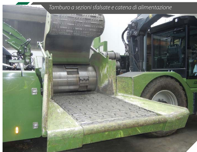
Tamburo a sezioni sfalsate e catena di alimentazione